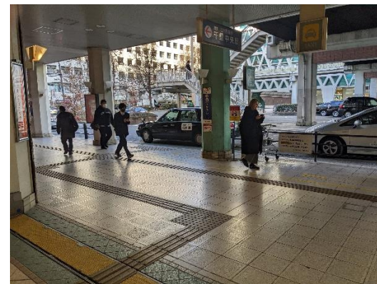
反対側がタクシー乗り場