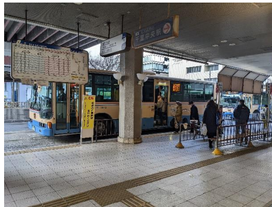
正面がバス乗り場 (①番)