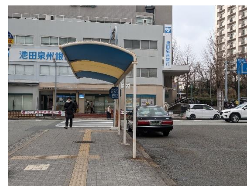
地上に出た所真直ぐ、右側タクシー乗り場